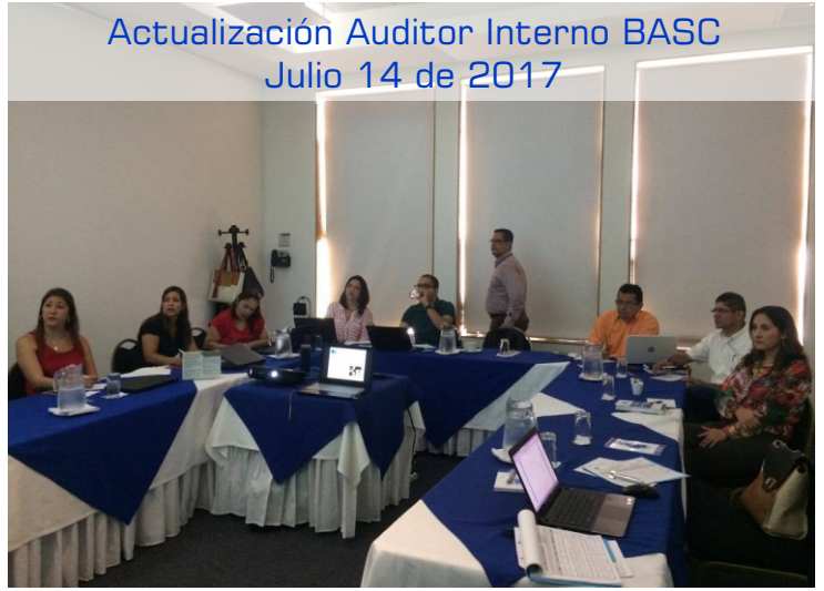
Actualización Auditor Interno BASC Julio 14 de 2017