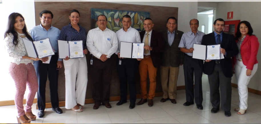
XLV Entrega Certificación BASC Julio 11 de 2017