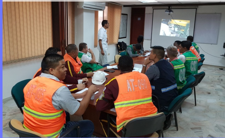
CIAMSA S.A. Inspección de contenedores Buenaventura, septiembre 20 de 2017