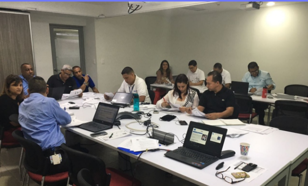
Agosto 14 y 15 de 2017 LABORATORIOS BAXTER S.A. Formación Auditor Interno BASC. Septiembre 4 y 5 de 2017