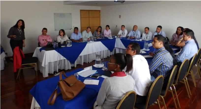
Entrevistas y visitas domiciliarias con énfasis en seguridad. Julio 27 de 2017