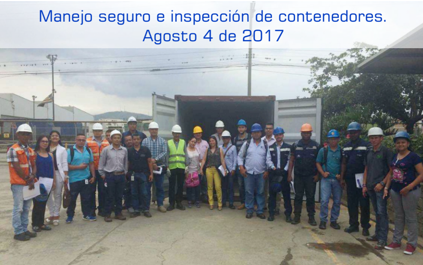
Manejo seguro e inspección de contenedores. Agosto 4 de 2017