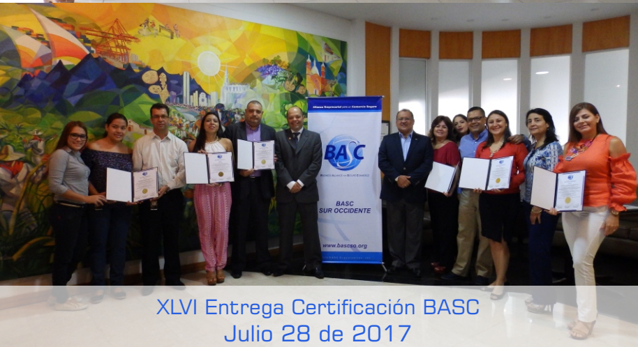
XLVI Entrega Certificación BASC Julio 28 de 2017

Hacemos un reconocimiento por su ardua labor, a seis empresas que demostraron una excelente implementación y mejora continua a través del fortalecimiento del Sistema de Gestión en Control y Seguridad BASC, obteniendo excelentes resultados: