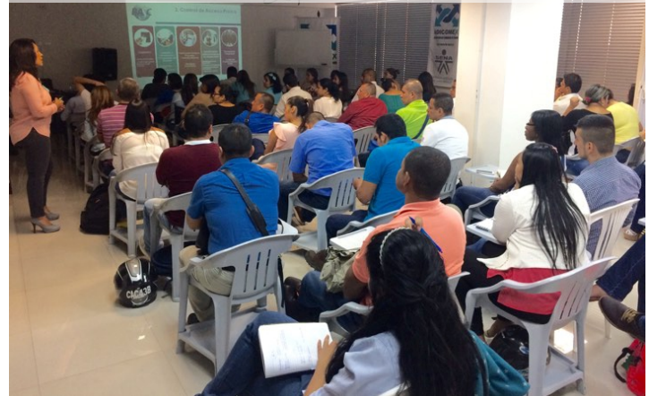
Sensibilización BASC Julio 28 de 2017