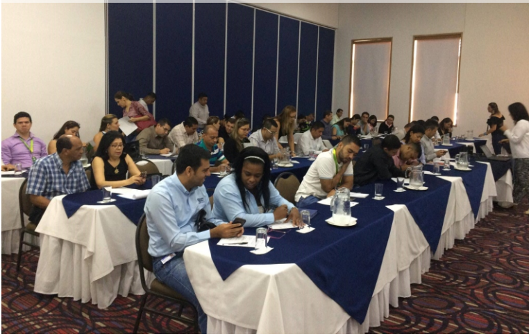
Buenas prácticas anticorrupción. Julio 7 de 2017