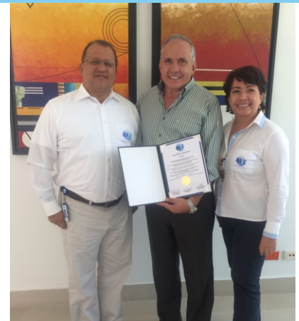
Transportes Centro Valle S.A. Septiembre 5 de 2017