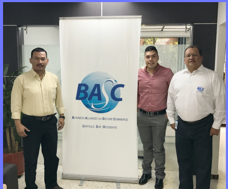
Reunión de Bienvenida - Agosto 24 de 2017