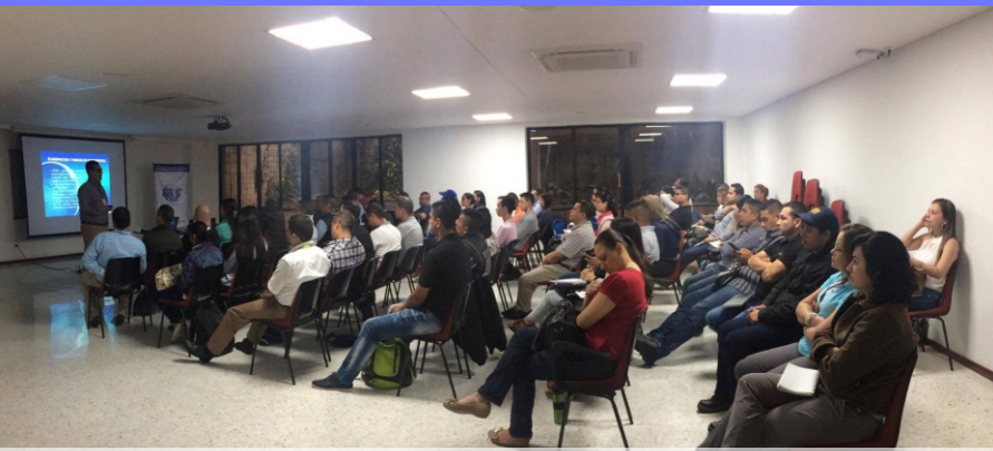
Fraude documental monitoreo de la correspondencia e inspección de paquetes sospechosos. Agosto 11 2017