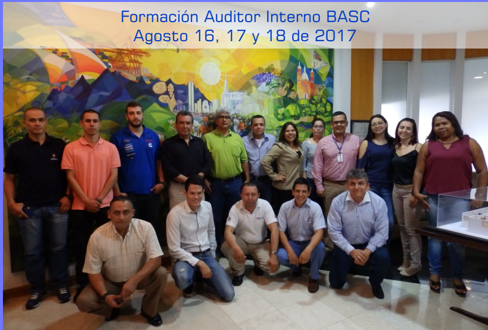
Formación Auditor Interno BASC Agosto 16, 17 y 18 de 2017